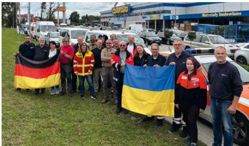
■ Gespendete Einsatzfahrzeuge wurden an der polnisch-ukrainischen Grenze bei Przemysl an die Helfenden der ukrainischen Malteser übergeben.

Noch am Tag des Kriegsbeginns konnten wir einen ersten Hilfsgütertransport direkt in die Ukraine schicken. Die dort geladenen Feldküchen gingen direkt an der Front in den Einsatz, um die Menschen mit einer warmen Mahlzeit zu versorgen. Vier Küchen wurden durch die russische Armee bereits zerstört. Im Jahr 2022 haben wir 94 Hilfstransporte organisiert und über 1000 Tonnen an Hilfsgütern versendet. Medikamente, Krankenhausbetten, Rollatoren, Lebensmittel, Verbandsmaterialien oder auch Hygienematerial sind Sachspenden, die die ukrainischen Partner dringend benötigen und durch die Unterstützung unserer Freunde, Spender und Förderer möglich gemacht wird. Gespendete Gelder kommen u. a. beim Erwerb von Fahrzeugen zum Einsatz und bilden so die Grundlage zur Durchführung der Hilfstransporte. Unsere Hilfeleistung erfolgt immer in enger Absprache mit unseren Partnern, den Maltesern und der Caritas in der Ukraine.