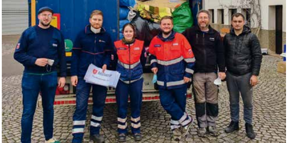
Das Foto zeigt eine Gruppe Helfende aus Lebach nach der Verladung eines Hilfsgütertransportes in die Ukraine.

Am Morgen des 24. Februars konnten die Malteser einen Hilfsgütertransport von Trier direkt in die Ukraine schicken. Eingeladen wurden neben sieben Zelten, einigen Rollstühlen und Rollatoren auch drei Feldküchen und weitere Hilfsmaterialien, wie OP-Masken, Schutzkittel und Verbandmaterialien. Die geladenen Hilfsgüter kamen gut im Kriegsgebiet an und wurden sofort verwendet.